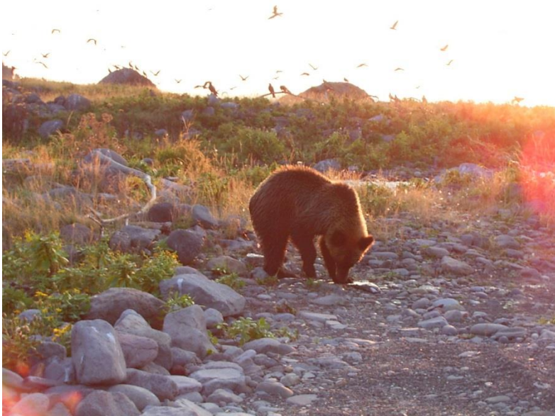
図 1 : サケを食べるヒグマ

らかになりました。道東地域ではサケの利用割合が 19% (Period 1)から 8% (Period 3)まで減少し、陸上動物(エゾシカや昆虫)の利用が 64%から 8%にまで減少していました。また、道南地域では陸上動物の利用割合が 56% (Period 1)から 5% (Period 3)まで減少していました。窒素同位体比値の時間的変化から、この大規模な食性の変化は、概ねここ 200 年の間に急激に進行したことが示されました。200 年前は、明治政府による開発が本格化した時期と一致しています。